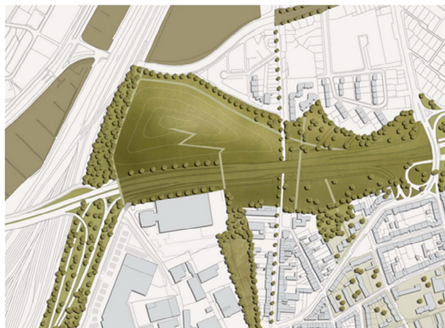
Abb.: L94 Landschaftsarchitekten